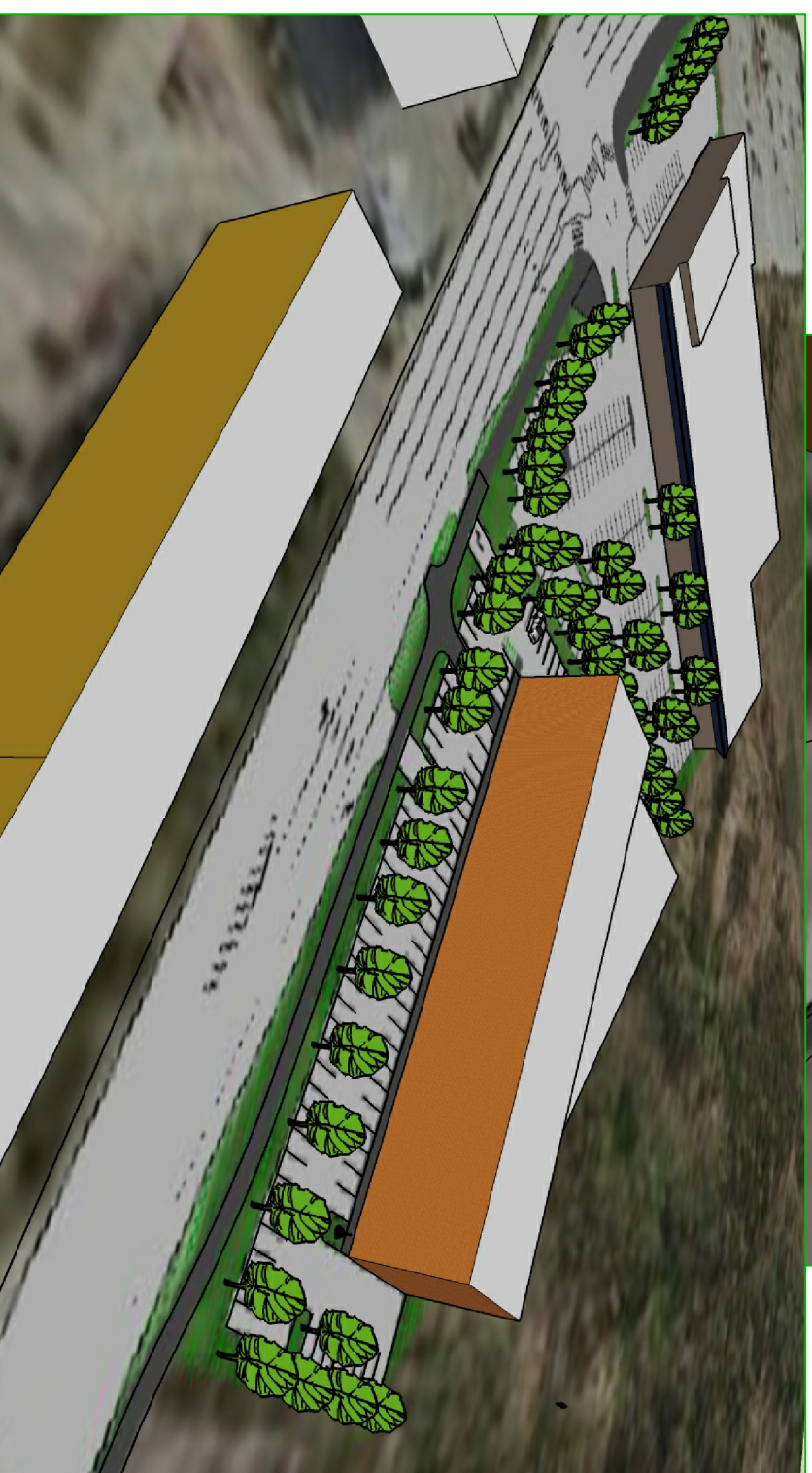
VAADE PLANEERINGUALALE JA NAABERKRUNDILE KÕRGEHALT