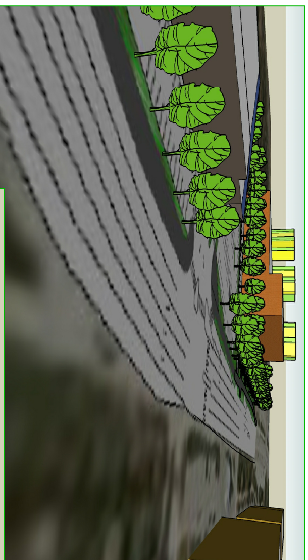
VAADE PIKI KALDA TEEDE KESKLINNA SUUNAS