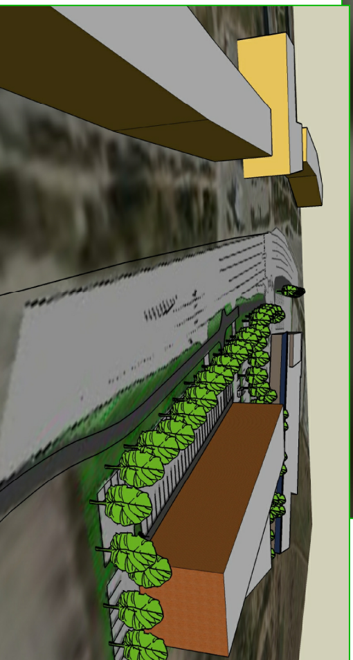
VAADE PIKI KALDA TEEDE PROJEKTEERITUD MAXIMA SUUNAS