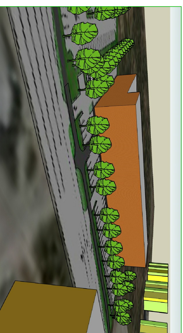
VAADE PLANEERINGUALALE KALDA TEE POOLT